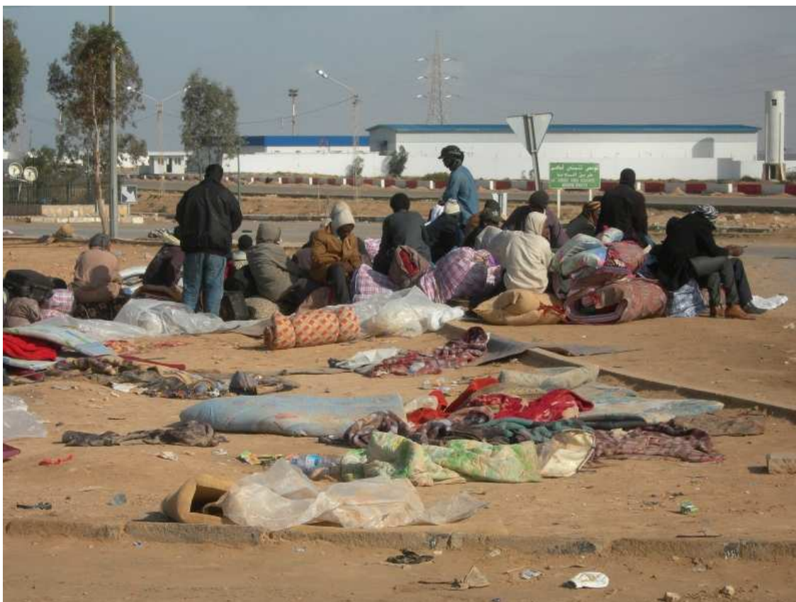
Sur la frontière Tunisie-Lybie

Cette mission conjointe avait notamment pour objectif d'évaluer la situation des personnes déplacées à la frontière entre la Tunisie et la Libye, de percevoir les conséquences pour la Tunisie des pressions exercées par l'Italie et l'Union européenne. Elle avait également pour but de renforcer les liens avec les associations et militants tunisiens.