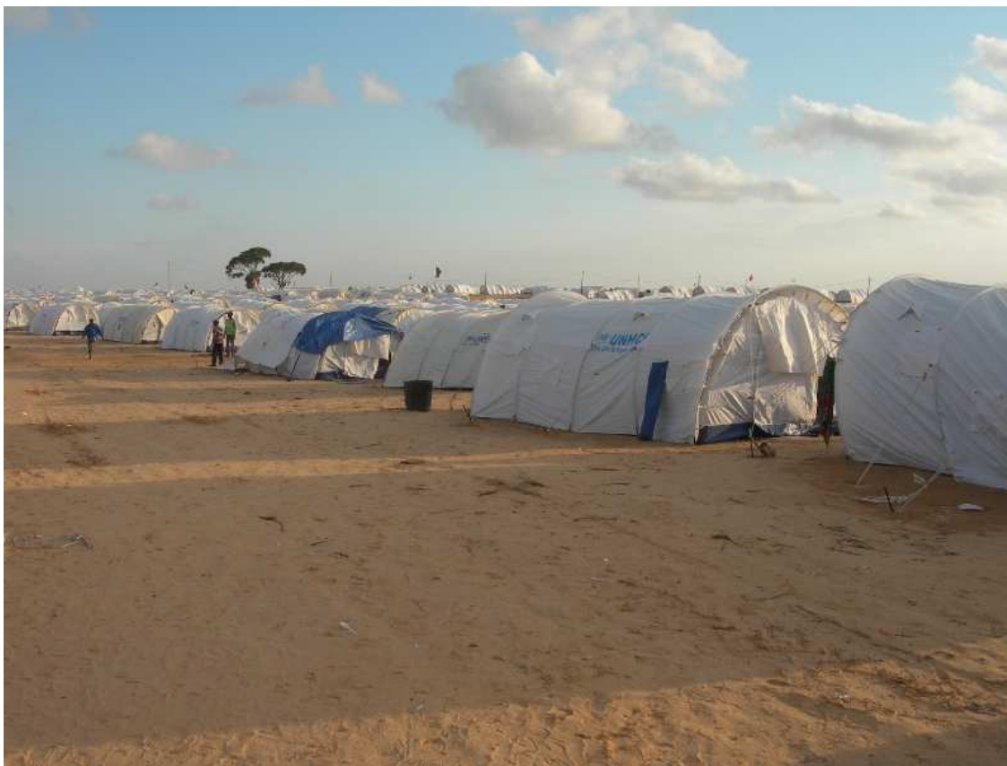
Camp de La Choucha

A leur arrivée à Ras Ejdair, les réfugiés sont transférés dans des camps « de transit » à quelques kilomètres de la frontière dont le plus grand, celui de La Choucha peut accueillir jusqu'à 15 000 personnes.