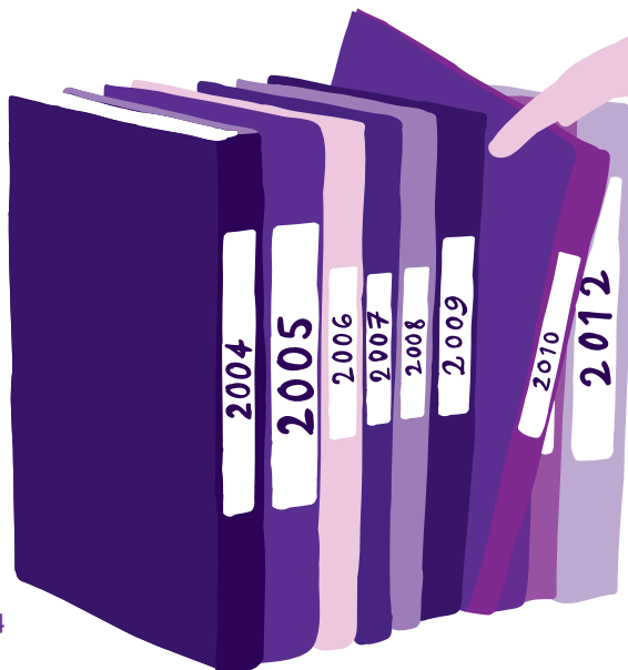
按年份整理您的材料