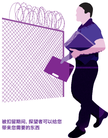
被扣留期间, 探望者可以给您带来您需要的东西

你有权每天会见来访者: 来访者只需要携带身份证件, 便可前来。他们最好有合法的身份!