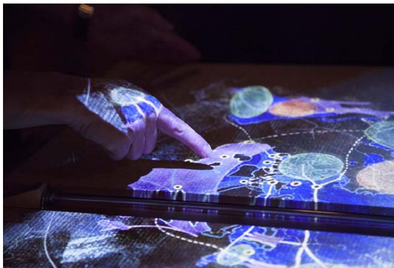
Moving Beyond Borders