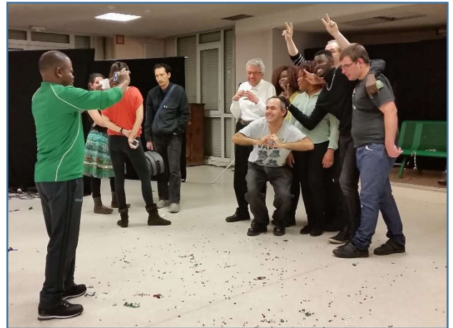
Répétitions pour le spectacle « Puisqu'il s'agit de Vivre » présenté au Théâtre de la Fontaine d'Ouche avec Itinéraires Singuliers et le CH La Chartreuse

Une première pour la Cimade de Dijon : des bénévoles de l'association était également sur les planches : l'occasion de découvrir de nouveaux talents dans l'équipe !