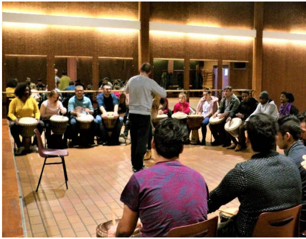
Atelier Musique par le projet Adonis de l'association étudiante ACEF