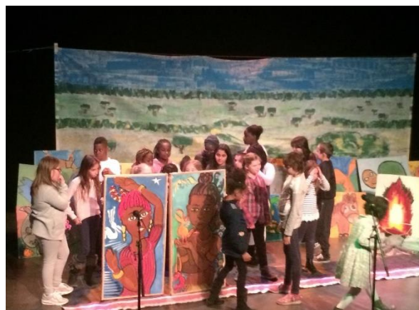
Spectacle « La Péniche en carton » lors de Migrant'Scène à Nevers

Mais petit à petit ce sont également les personnes accompagnées qui conçoivent le festival. A Nevers, le spectacle « La péniche en carton » a été imaginé par des enfants dont les parents sont passés à la permanence. La totalité du spectacle a été montée avec des bénévoles de la Cimade, des enfants d'un centre de loisirs, des parents.