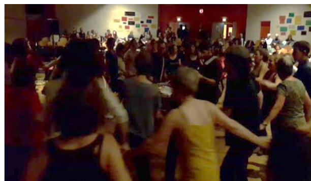
Temps festif à la Session 2017, à Poitiers

En 2017, 3 adhérents du groupe de Dijon se sont rendus à la Session annuelle de l'association. La Session est un événement interne qui rassemble tous les ans 350 bénévoles et adhérent.e.s et salarié.e.s de la Cimade et qui permet d'échanger entre militant.e.s. C'est un week-end convivial, ouvert aux bénévoles sur inscriptions. C'est un temps de rencontre mais aussi de débats sur des positions politiques du mouvement.