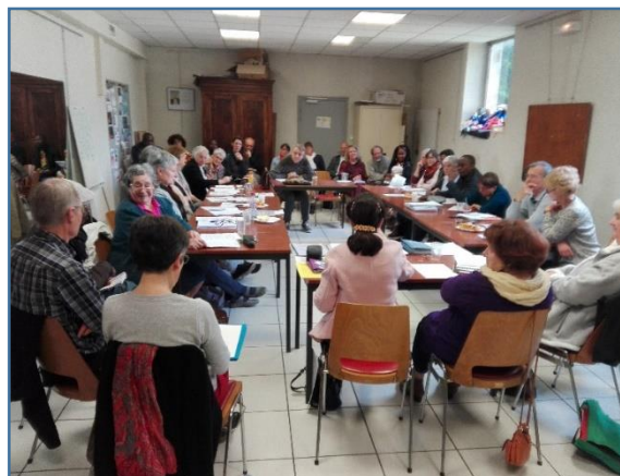
Assemblée générale régionale le 13 mai 2017 à Dijon