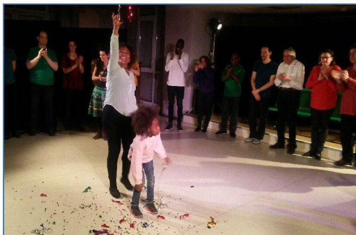
Répétitions pendant le spectacle « Puisqu'il s'agit de Vivre-

En 2017, des équipier.e.s de la région sont intervenu.e.s auprès de : la CGT(21), Mission locale (21 et 25), IRTESS (21), CFDT(71).