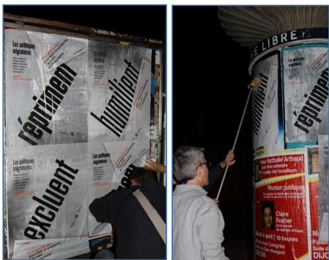
Bénévoles de Dijon...en action !

Plusieurs groupes locaux ont suivi des jeunes en difficulté administrative (reconnaissance de minorité, obtention de titre de séjour à la majorité) et c'est dans le cadre de ces sollicitations qu'ils ont sollicité des rendez-vous avec les Conseils Départementaux (71, 25, 21) au regard du suivi socio-éducatif insuffisant de ces jeunes souvent hébergés dans des hôtels ou foyers.