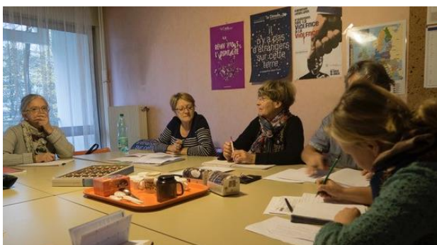
Réunion d'équipe à Montbéliard en novembre 2017

Sur sollicitation d'un bénévole, la salariée anime depuis l'automne à Dijon des temps mensuels de partage d'information juridiques et d'auto-formation . Il s'agit d'amener les bénévoles à utiliser les outils et ressources produits par l'association. Ce format sur-mesure permet à des nouveaux bénévoles d'apprendre en plus petit groupe.