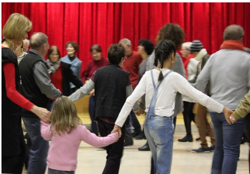
Journée festive pour le festival Migrant'Scène à Ouges (21)