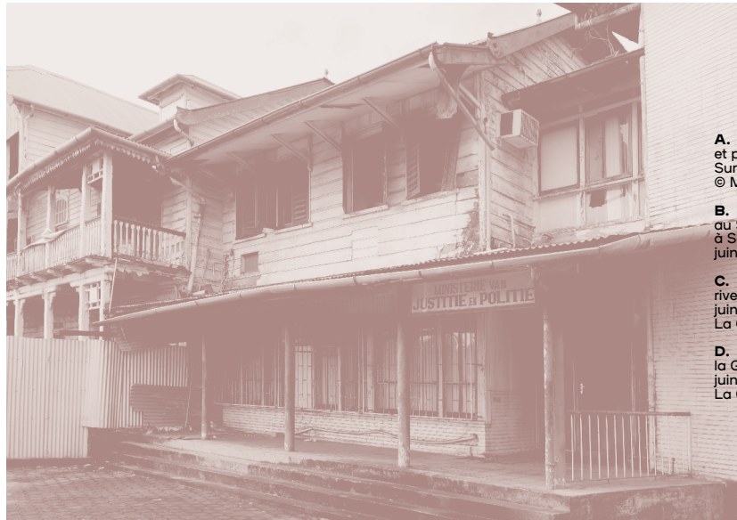
A. Ministère justice et police, Paramaribo, Suriname, juin 2019.