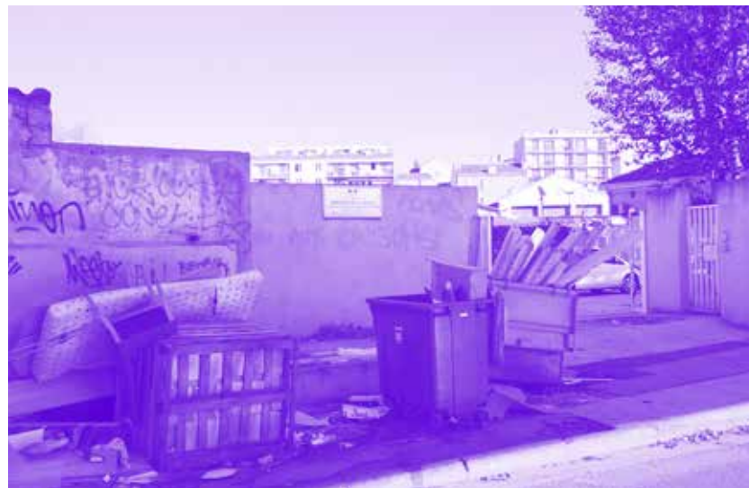
L'entrée du tribunal où siège le JLD.

Dans certaines situations, un étranger non européen peut être placé à son arrivée à la frontière dans une zone d'attente avant d'être réacheminé à l'étranger ou admis en France. La procédure de placement en zone d'attente est encadrée et limitée dans le temps (vingt-six jours maximum). Tout au long de la procédure, l'étranger peut bénéficier de recours. Le placement en zone d'attente concerne les étrangers qui: • font l'objet d'un refus d'entrée sur le territoire • demandent l'asile à la frontière • sont en transit et que l'embarquement vers leur pays de destination finale a été refusé ou que les autorités de ce pays les ont refoulés vers la France.